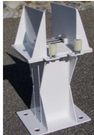
Poteau de fermeture