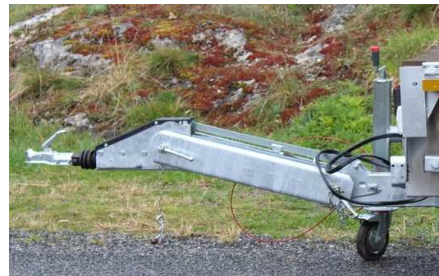
Timon articulé à anneau