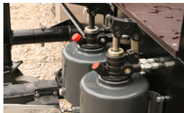
Pompe hydraulique pour relevage de la toiture