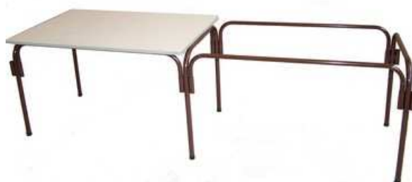
Table seule : 2 pieds par table :

Modèle en linéaire : 3 pieds pour 2 tables