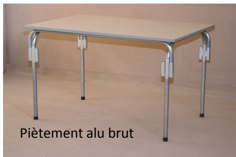
Piètement alu brut