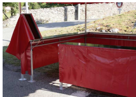
Détail accès porte