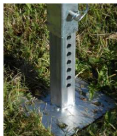
Pied de buvette