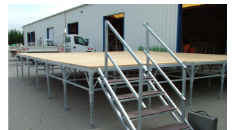
Escalier avec garde corps

- Fabricant - Nous ne faisons pas de location.