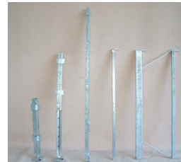
Pieds -Lisses -entretoises-