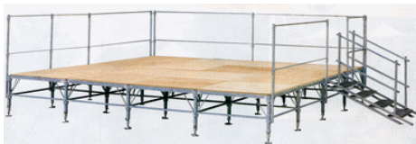
Podium partie basse

- Fabricant - Nous ne faisons pas de location.