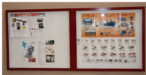
Laquage sur modèle JASMIN