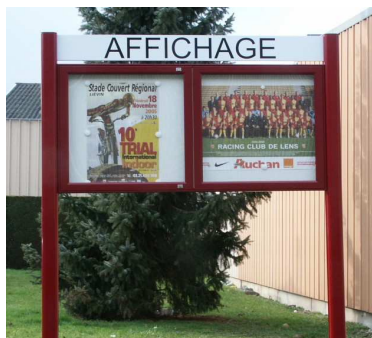
Option pieds et bandeau