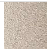
beton crépi sable