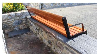
Modele sur muret