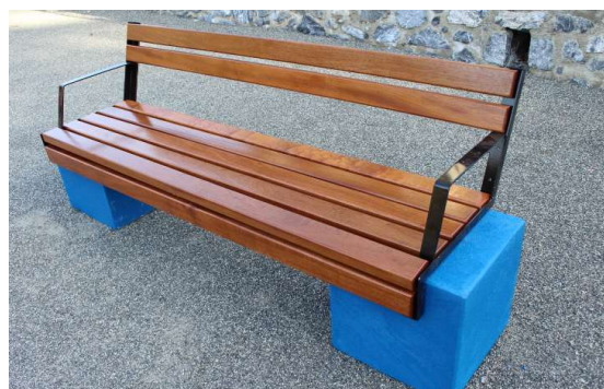
Banc Théza sur plots couleurs