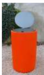
Peint avec option