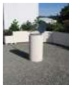
Crépi sable avec