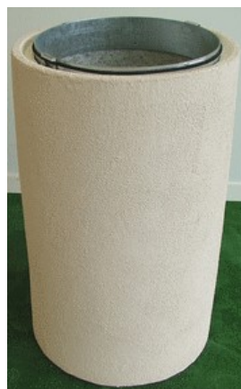
Modele crépi sable