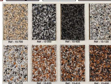
Finition gravillons lavés