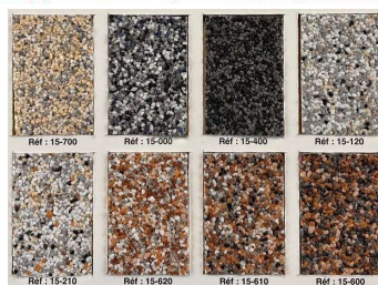
Finition gravillons lavés