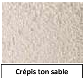
Crépis ton sable