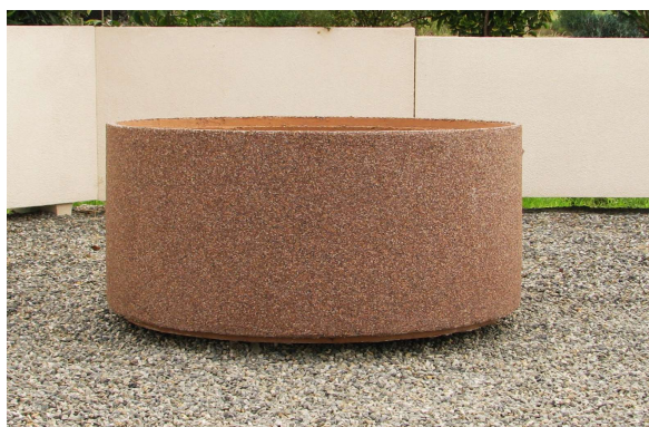
Finition gravillons lavés