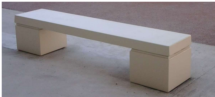
Finition béton blanc naturel