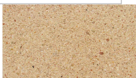
Aspect pierre ivoire