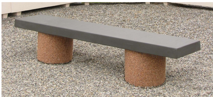
Finition pieds gravillons lavés/lame couleur gris ardoise