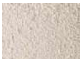
CREPIS TON SABLE