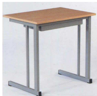
Table individuelle avec casier (en option)