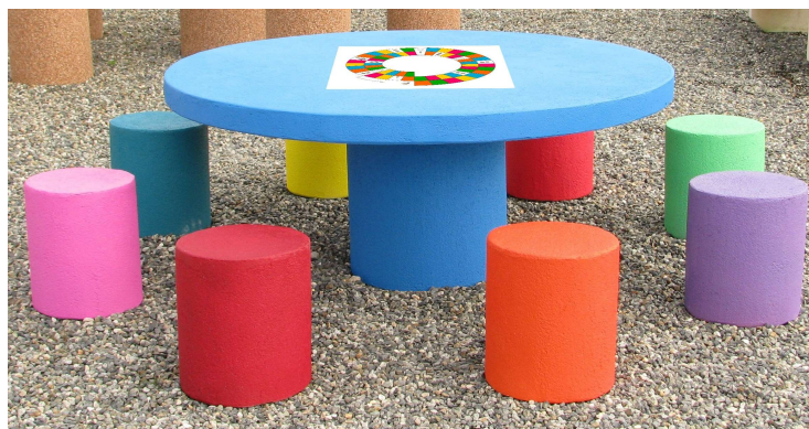
Finition couleur peint