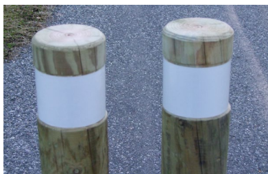
Bande rétroréfléchissante blanche

Nous consulter Le cout de transport dépend des quantités et du département de livraison.