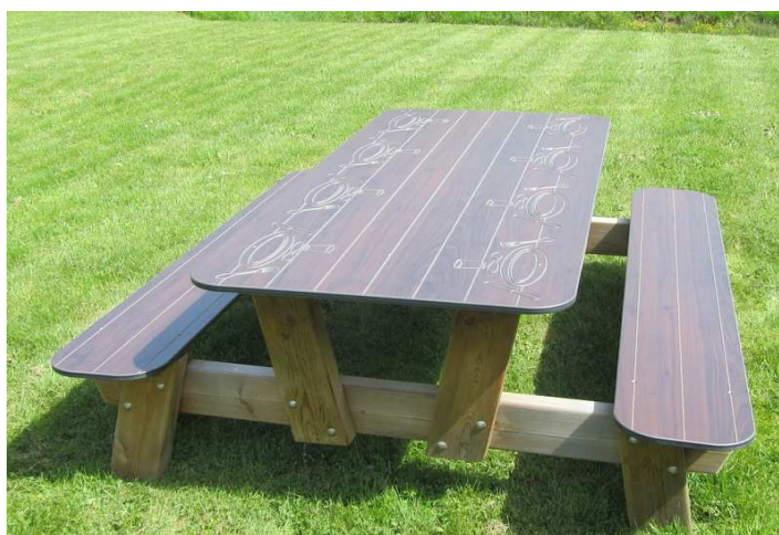
Finition coloris WALNUT

Nous consulter Le cout de transport dépend des quantités et du département de livraison.