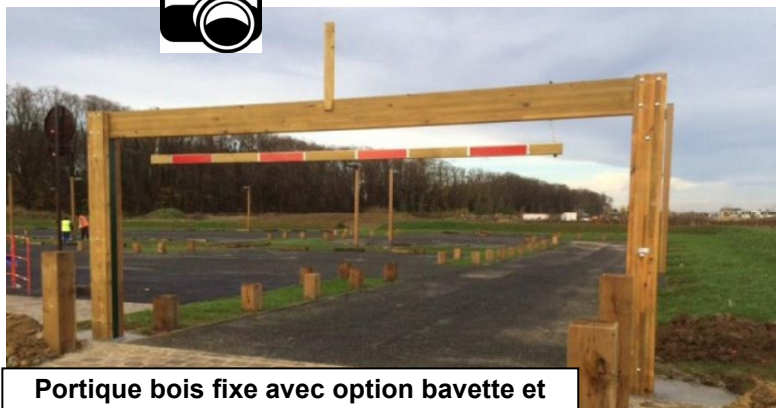
Portique bois fixe avec option bavette et option support panneau