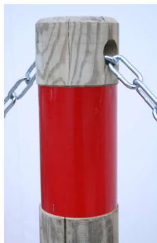
Perçage passage chaîne

Nous consulter Le cout de transport dépend des quantités et du département de livraison.