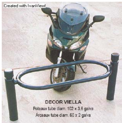
DECOR VIELLA Poteaux tube diam. 102 x 3,6 galva Arceaux tube diam. 60 x 2 galva