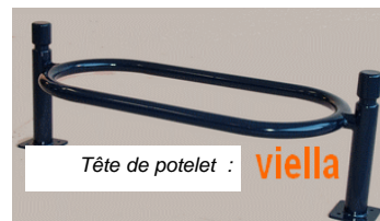
Tête de potelet : viella