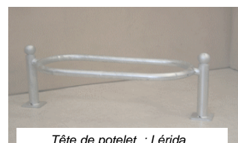
Tête de potelet : Lérida