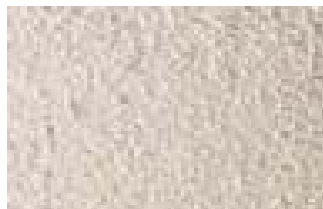
CREPIS TON SABLE