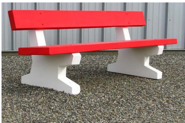
BANC RIVIERA LAME ET ASSISE COULEUR