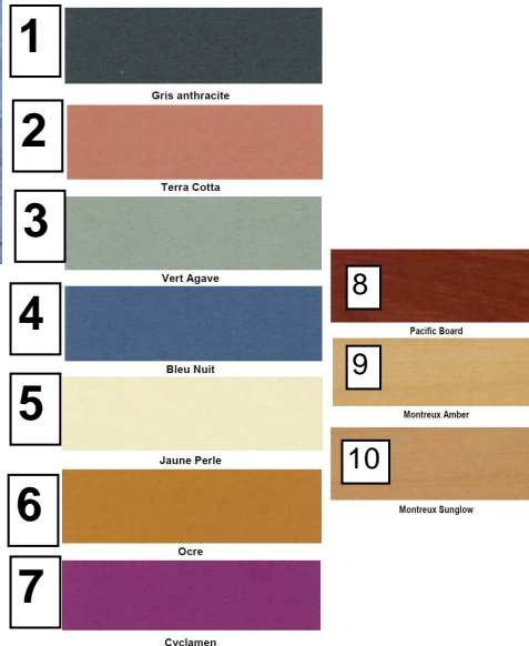
10 Couleurs possibles du TRESPA