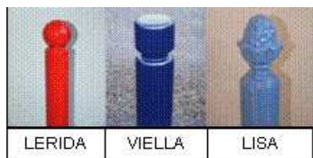
Décor poteaux en option