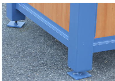
Détail Platines de mise à niveau