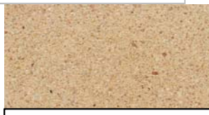
Aspect pierre ivoire