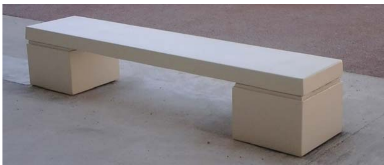
Finition béton blanc naturel