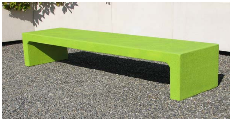
Finition béton couleur peint