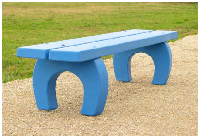
Finition béton couleur peint