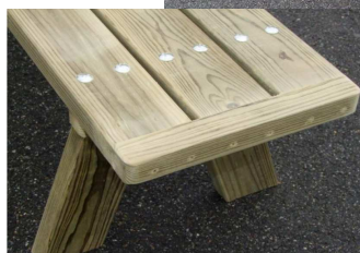
Détail renfort et embouts