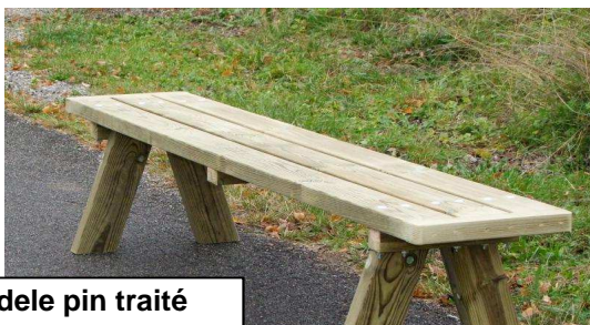
Modele pin traité