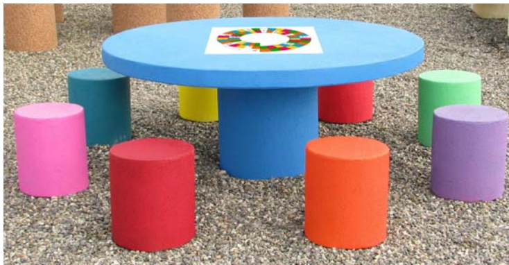
Finition couleur peint