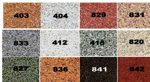
Finition gravillons lavés