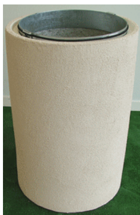
Modele crépi sable