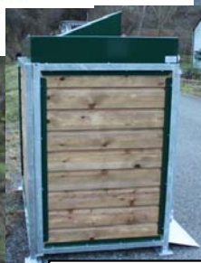
Vue de côté