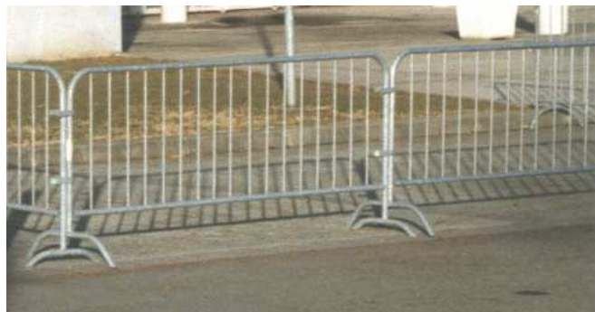
Barrière de manifestation Crabere