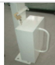
Barrière levante St Felix