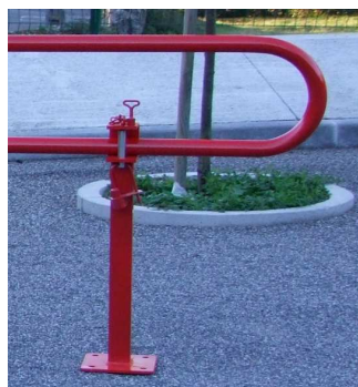
Pied de soutien