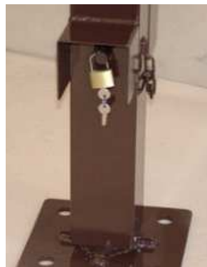
Systeme fermeture avec cadenas