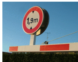
Option support panneau et panneau