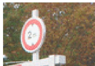
Option : support panneau et panneau

Livraison proposée en semi remorque Prévoir un chariot elevateur pour déchargement par côté Prévoir les plots béton a chaque poteau 0,80 mx 0,80x0,80 m Temps de sechage avant la pose : 3 semaines minimum.