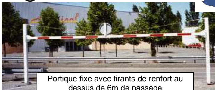
Portique fixe avec tirants de renfort au dessus de 6m de passage