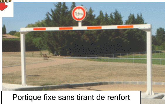
Portique fixe sans tirant de renfort