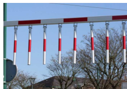
Jalon tubes vesticaux

Nous consulter Le cout de transport dépend des quantités et du département de livraison.