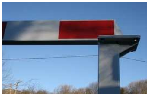
Fixation de la lisse sur le poteau