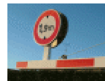
Options : Support panneau et panneau