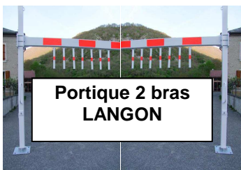
Portique 2 bras LANGON