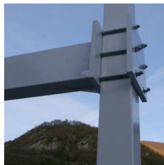
Detail : Platines et boulons