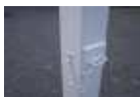
Detail : Tige traversante inox