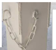
Détail tige traversante avec chaîne