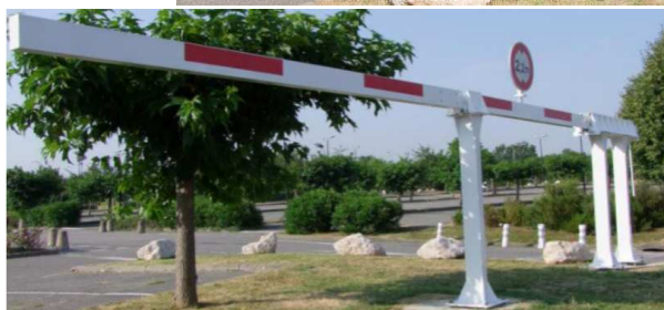
Portique coulissant manuel